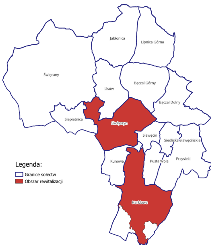
Mapa 2 - Obszar rewitalizacji na terenie Gminy Skołyszyn