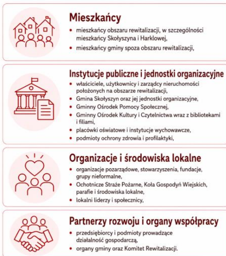
Rysunek 11 - Interesariusze rewitalizacji

Interesariuszami rewitalizacji w Gminie Skotyszyn są wszystkie podmioty i osoby, które mieszkają, działają, świadczą usługi, prowadzą działalność społeczną, gospodarczą lub publiczną na obszarze rewitalizacji albo są zainteresowane jego rozwojem.