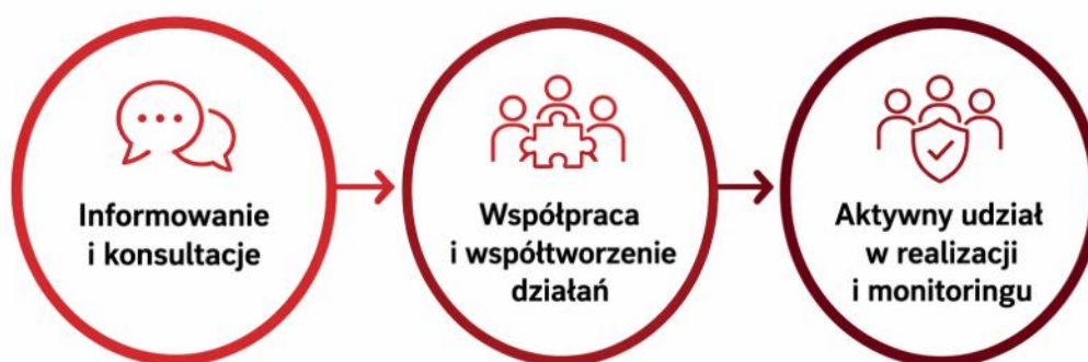
Rysunek 10 - Zaangażowanie lokalnych interesariuszy