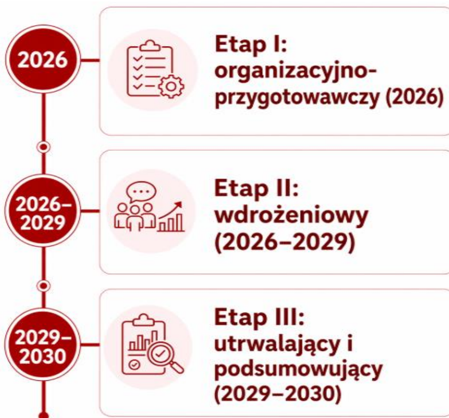
Rysunek 8 - Etapy wdrażania GPR

Realizacja Gminnego Programu Rewitalizacji Gminy Skołyszyn do roku 2030 będzie miała charakter wieloletni i etapowy. Ze względu na społeczny charakter przedsięwzięć rewitalizacyjnych oraz potrzebę ich dostosowywania do zmieniających się warunków, rekomenduje się przyjęcie ramowego harmonogramu realizacji obejmującego trzy etapy.