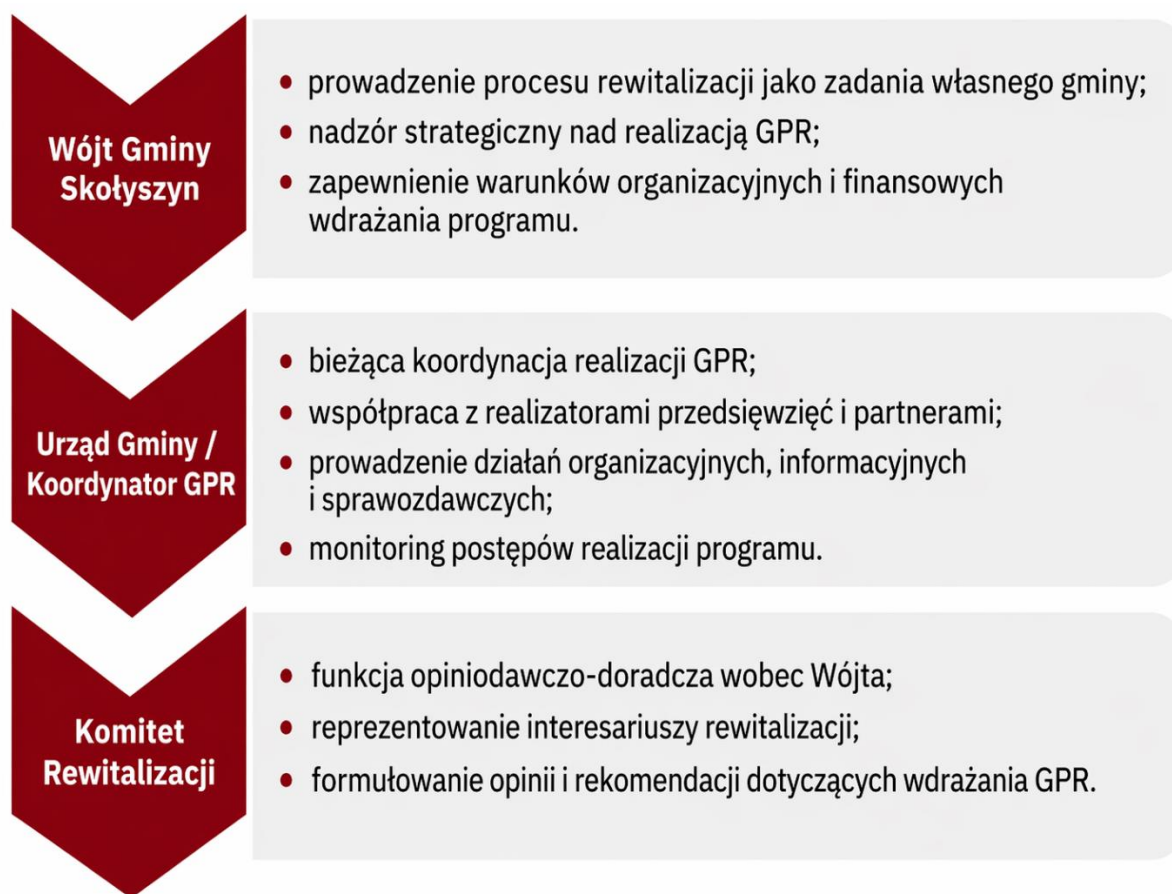
Rysunek 7 - System realizacji GPR