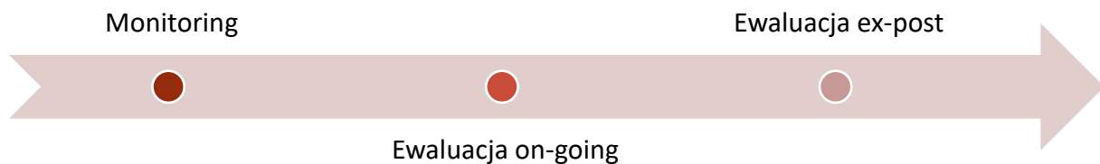
Rysunek 9 - System ewaluacji dokumentu GPR