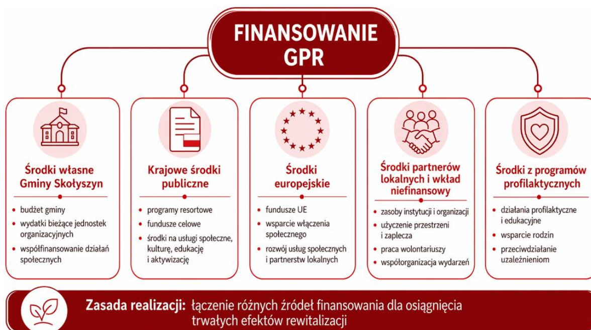
Rysunek 6 - Źródła finansowania GPR

Trzecim ważnym źródłem finansowania będą środki europejskie, w szczególności środki ukierunkowane na włączenie społeczne, rozwój usług społecznych, edukację, kulturę, aktywizację mieszkańców, wsparcie osób starszych, rodzin, dzieci i młodzieży, a także budowanie zdolności instytucjonalnej i partnerstw lokalnych. Dokument strategiczny pełni również funkcję instrumentu pozyskiwania środków zewnętrznych, w tym funduszy krajowych i środków europejskich, a spójność strategii z politykami krajowymi i europejskimi zwiększa prawdopodobieństwo uzyskania takiego wsparcia.