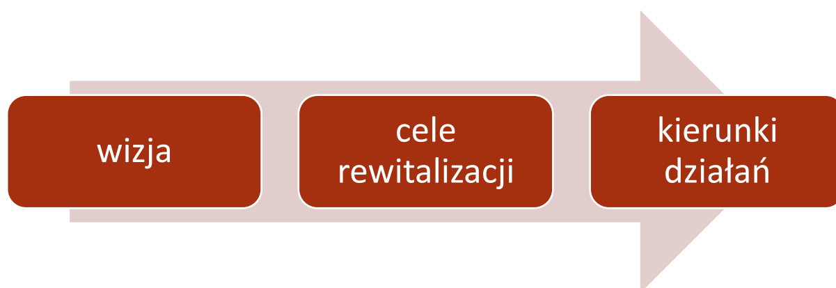
Rysunek 4 - Schemat struktury wdrożeniowej GPR

Cele rewitalizacji Gminy Skotyszyn do roku 2030 zostały określone na podstawie szczegółowej diagnozy obszaru rewitalizacji, w tym rozpoznania problemów społecznych, przestrzennych, technicznych, środowiskowych i gospodarczych występujących na podobszarach Skotyszyn i Harkłowa. Ich sformułowanie uwzględnia także hierarchię potrzeb rewitalizacyjnych oraz założenia najważniejszych dokumentów strategicznych gminy. Przyjęto, że cele rewitalizacji powinny odpowiadać przede wszystkim na zdiagnozowane zjawiska kryzysowe w sferze społecznej, a jednocześnie integrować działania społeczne z poprawą jakości przestrzeni, dostępności usług, rozwojem lokalnej aktywności oraz lepszym wykorzystaniem zasobów obszaru rewitalizacji.