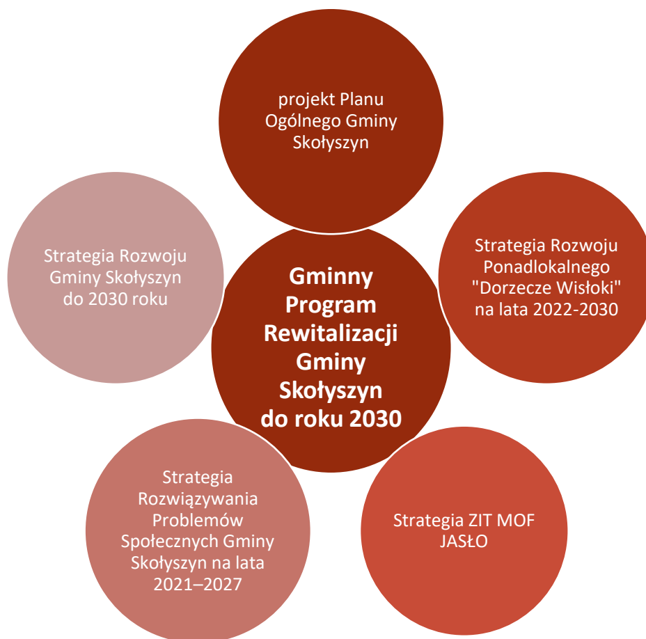
Rysunek 1 - Schemat zgodności GPR Gminy Skołyszyn z lokalnymi dokumentami

Równocześnie GPR pozostaje spójny ze Strategią Rozwiązywania Problemów Społecznych Gminy Skołyszyn na lata 2021-2027, która została opracowana na podstawie diagnozy społecznej, badań ankietowych, analizy SWOT oraz oceny realizacji poprzedniej strategii. Dokument ten formułuje założenia lokalnej polityki społecznej w postaci wizji, misji, celów i kierunków działań, a jego wdrażanie oceniono wysoko, wskazując na potrzebę kontynuacji zasadniczo wszystkich dotychczas realizowanych celów. GPR rozwija te założenia na obszarze rewitalizacji, koncentrując się na ograniczaniu zjawisk wykluczenia, wzmacnianiu integracji społecznej, poprawie jakości usług oraz odbudowie lokalnych więzi i aktywności mieszkańców.