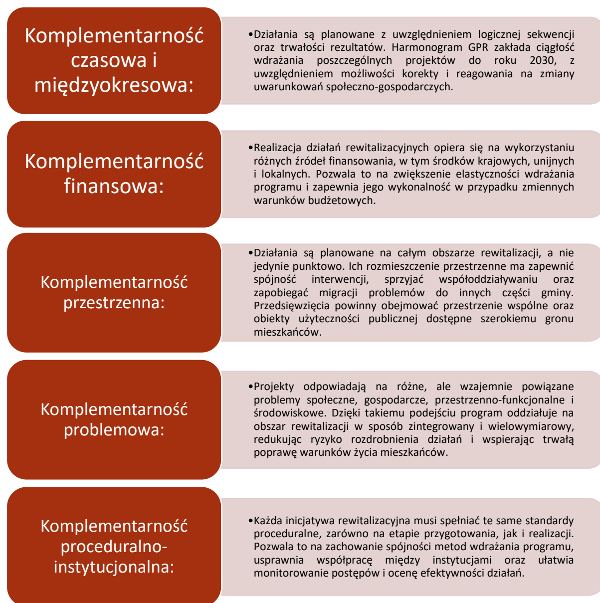
Rysunek 5 - Komplementarność działań i przedsięwzięć rewitalizacyjnych

Ważnym założeniem Gminnego Programu Rewitalizacji Gminy Skołyszyn do roku 2030 jest zapewnienie komplementarności działań rewitalizacyjnych, rozumianej jako integracja interwencji w następujących aspektach: