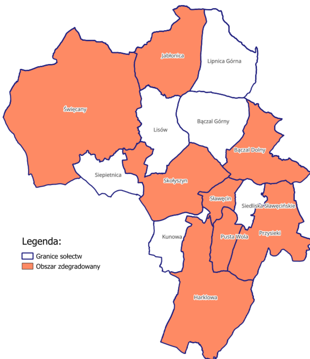
Mapa 1 - Obszar zdegradowany na terenie Gminy Skołyszyn

W kolejnym kroku analizie poddano wskaźniki w sferze gospodarczej, środowiskowej, przestrzenno-funkcjonalnej oraz technicznej. Współistnienie negatywnych zjawisk społecznych z problemami w pozostałych sferach wskazywało sołectwa z największym nagromadzeniem problemów. Średnia wartość wyniosła tutaj 6,43. Dlatego też, sołectwa dla których odnotowano wynik wyższy od średniej dla gminy, możemy zaliczyć do kategorii obszaru zdegradowanego. Są to sołectwa: Bączal Dolny, Harkłowa, Jabłonica, Przysieki, Pusta Wola, Skołyszyn, Sławęcin, Święcany.